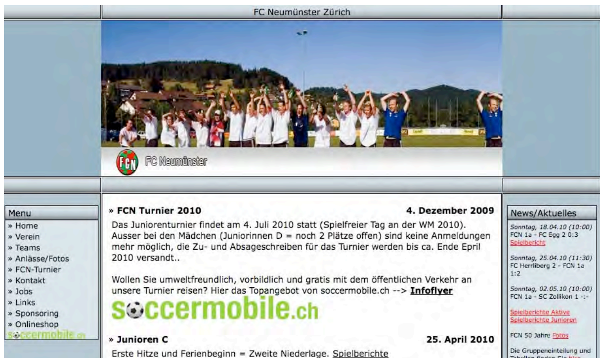
Abbildung 1: Bewerbung des Angebots von soccermobile.ch auf der Website des FC Neumünster im Vorfeld des FCN-Juniorenturniers vom 4.7.2010