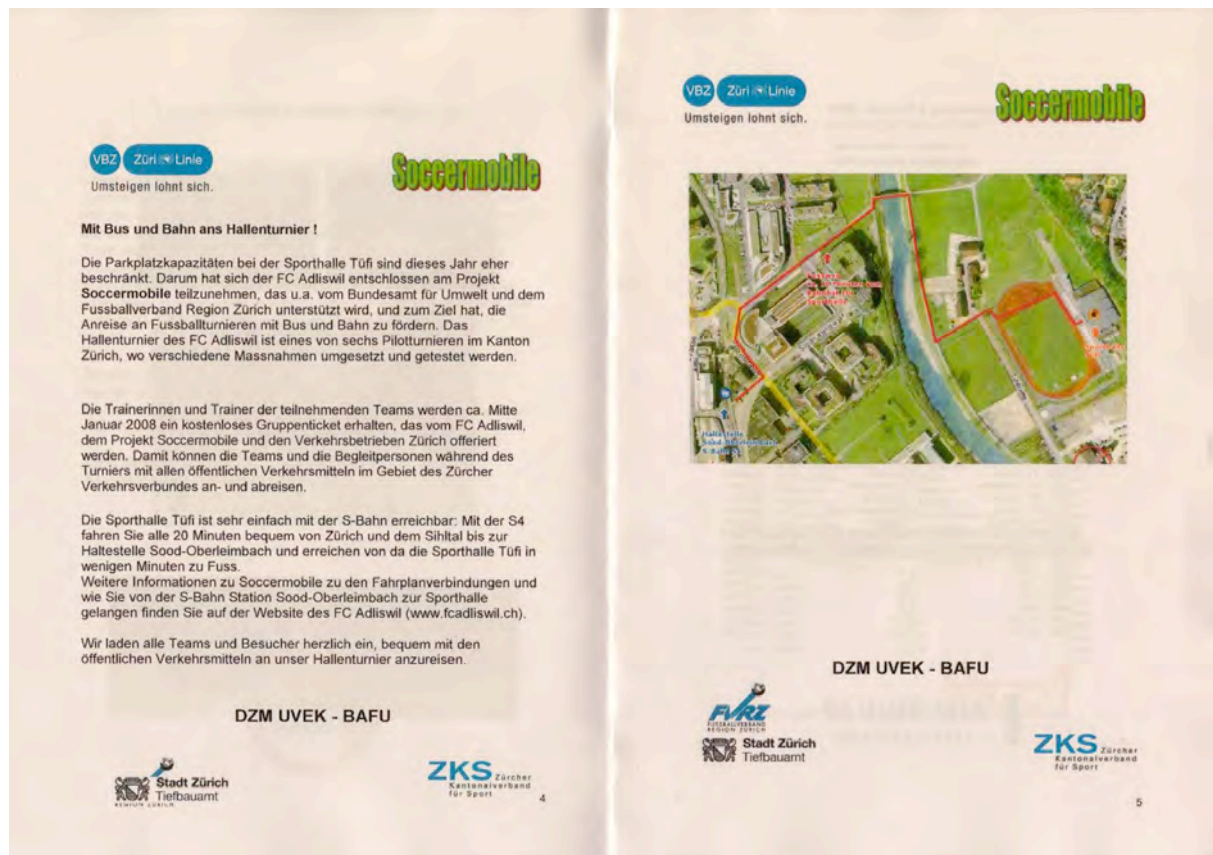
Abbildung 3: Information zum Pilotprojekt Soccermobile und der Erreichbarkeit mit dem öV im Programmheft des Hallenturniers FC Adliswil